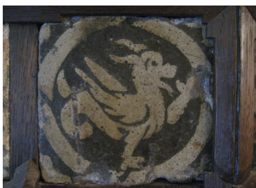
Pavés du Molay, XIV ème siècle.

L'activité, prévue sur une durée de deux heures, comprend :